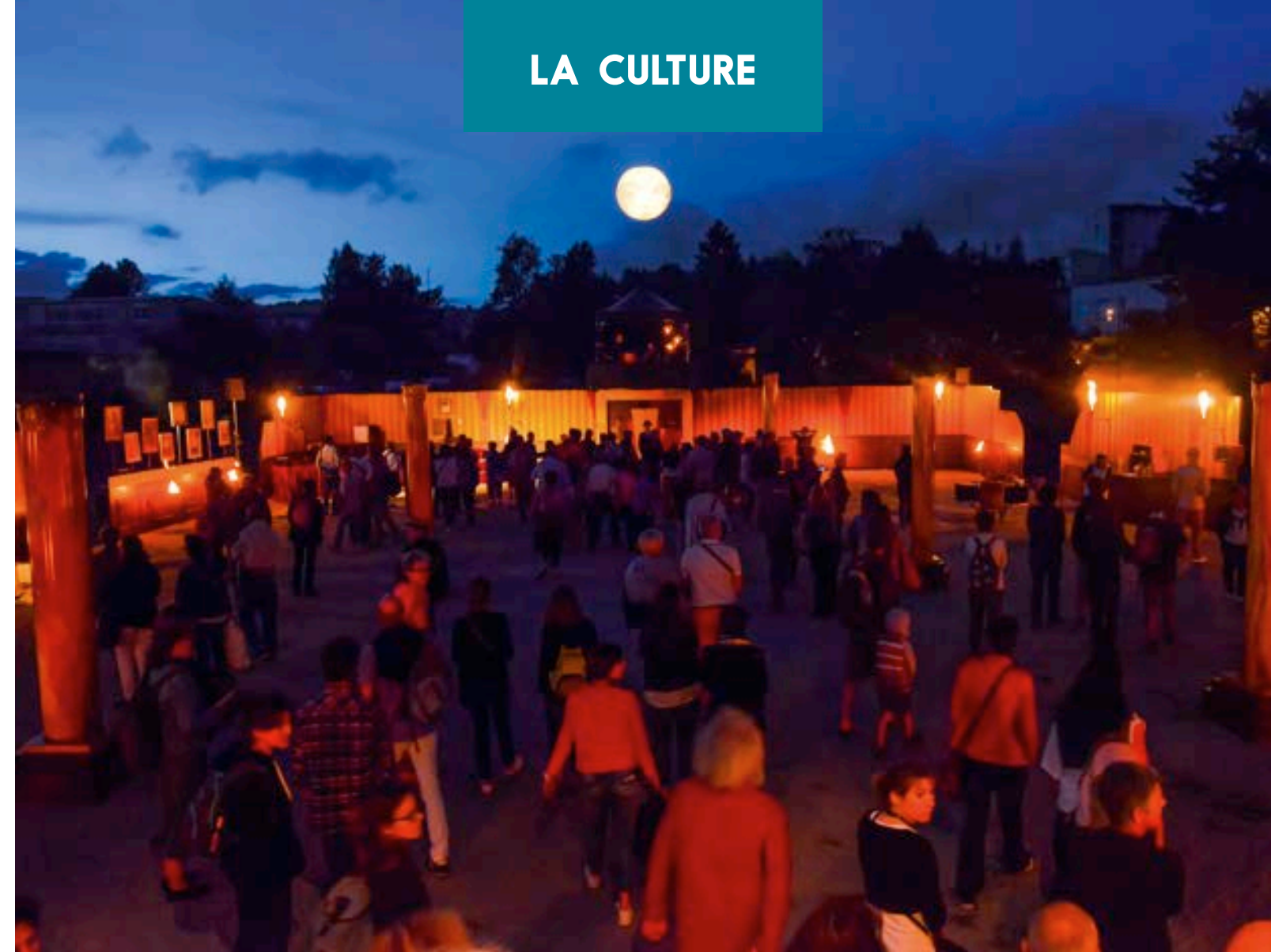
Cie Carabosse « Hôtel Particulier » - 2016