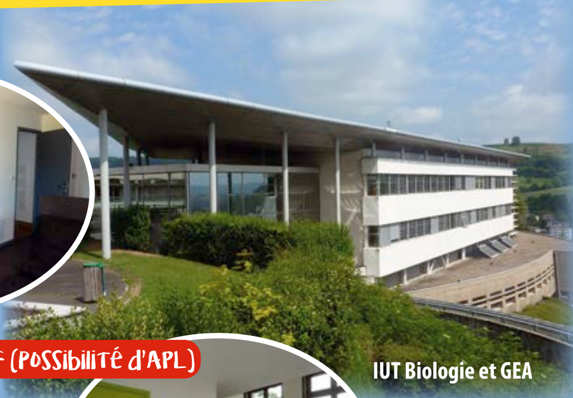
IUT Biologie et GEA