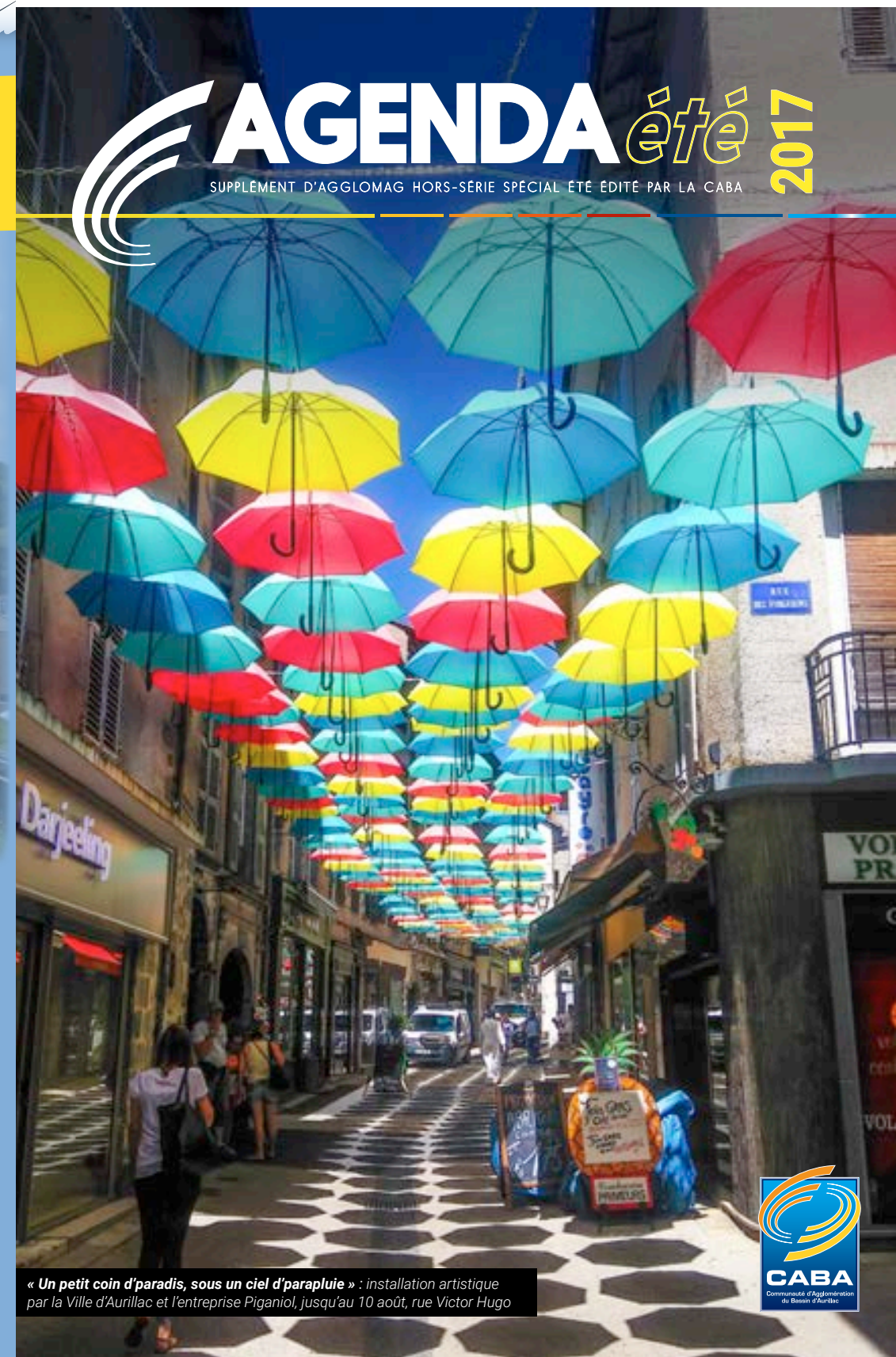
« Un petit coin d'paradis, sous un ciel d'parapluie » : installation artistique par la Ville d'Aurillac et l'entreprise Piganiol, jusqu'au 10 août, rue Victor Hugo